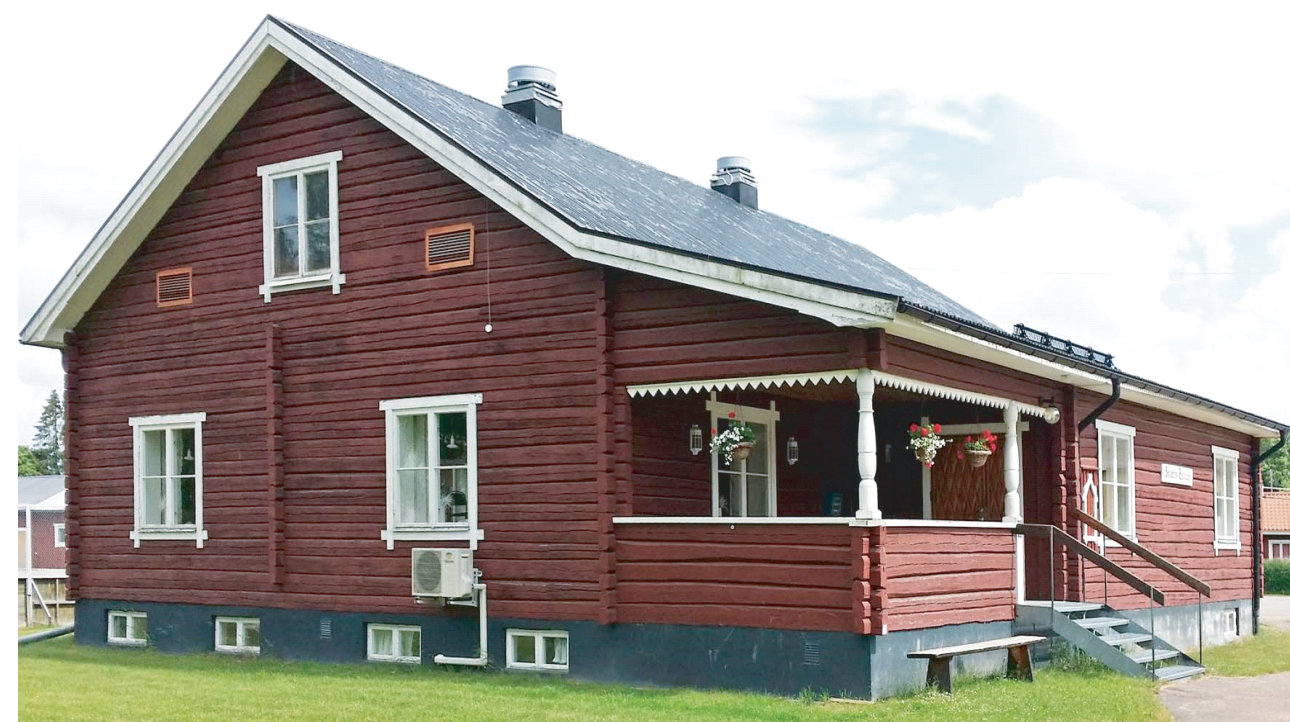
Solvarbo bystuga 2016