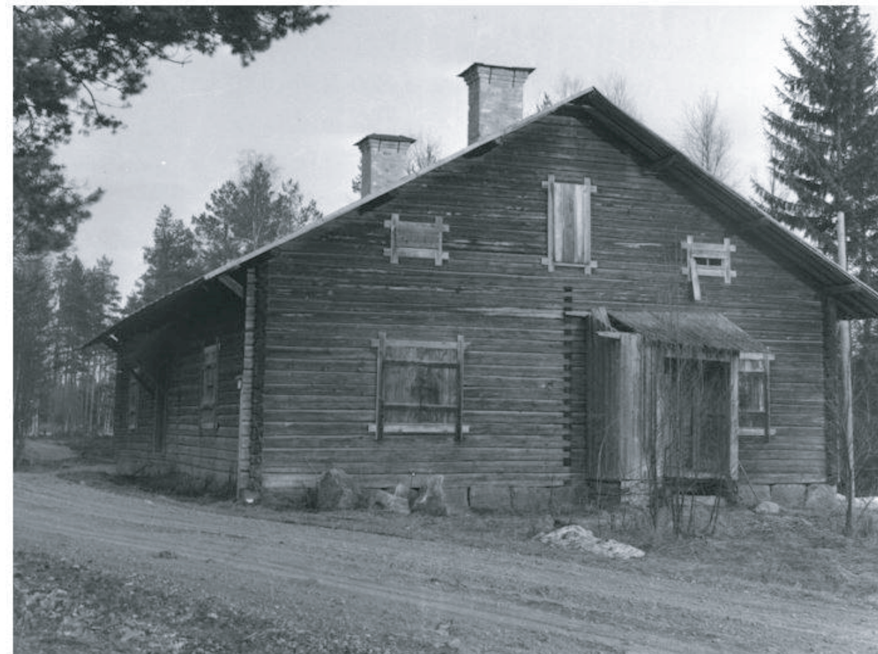
Knapptjärnsbaracken ca 1930